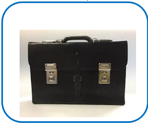
กระเป๋านักเรียน