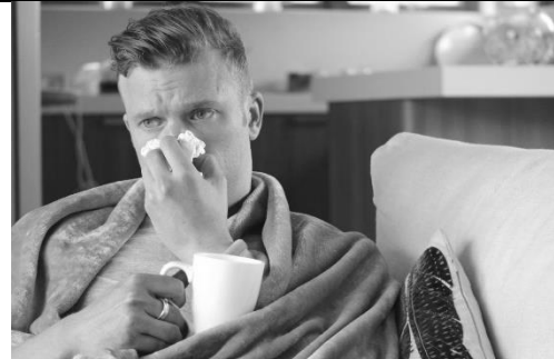
a runny nose