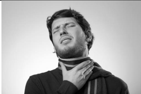
a sore throat