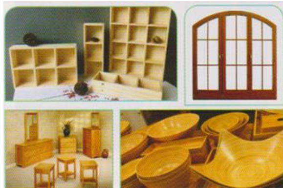
ผลิตภัณฑ์จากไม้เนื้ออ่อน

การใช้งาน : ประตู หน้าต่าง เฟอร์นิเจอร์ ของใช้ต่าง ๆ กล่องใส่วัสดุ งานตกแต่ง เครื่องดนตรีไทย