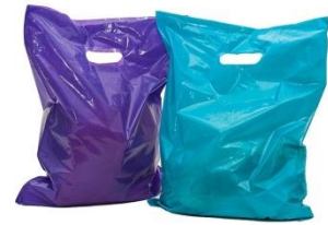
ผลิตภัณฑ์จากเทอร์โมพลาสติก