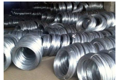
ผลิตภัณฑ์จากเหล็กกล้า