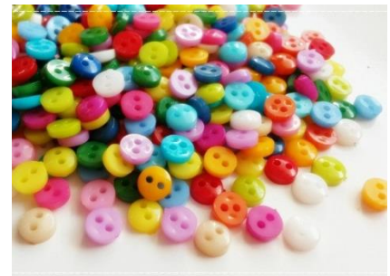
ผลิตภัณฑ์จากเทอร์โมเซตติง