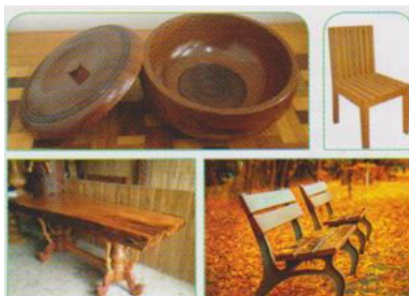
ผลิตภัณฑ์จากไม้เนื้อแข็ง

การใช้งาน : คาน โครงหลังคาบ้าน พื้น ฝาบ้าน ประตู หน้าต่าง เฟอร์นิเจอร์ ของใช้ในครัวเรือน เครื่องดนตรีไทย