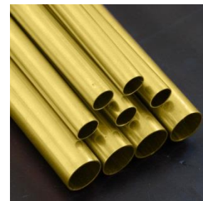
ผลิตภัณฑ์จากสังกะสี