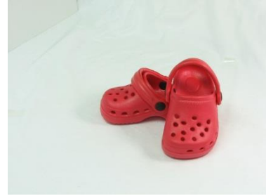
ผลิตภัณฑ์จากยางสังเคราะห์

ที่มา: http://cdn.mamaexpert.com/files/content/00093/cb330/conversions/big.jpg http://www.pneu-hyd.co.th/images/product-list/TUBE-MAX/PU-COIL.jpg https://www.be2hand.com/upload/200908/200908-13-204601-2.jpg