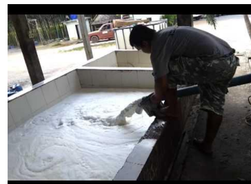
ยางธรรมชาติ