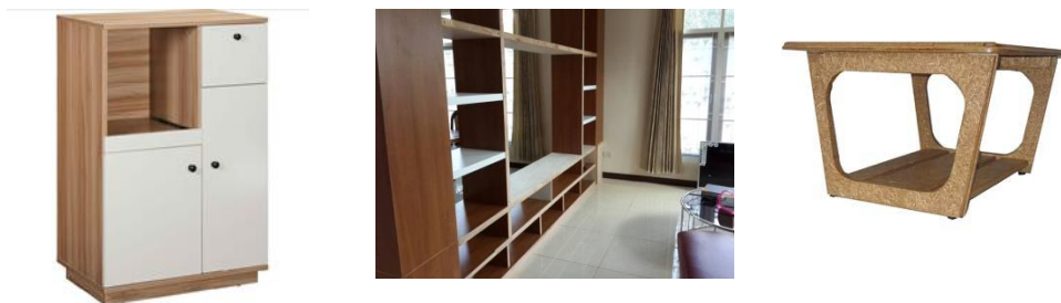
ผลิตภัณฑ์จากไม้อัด

การใช้งาน : ผนังบ้าน เฟอร์นิเจอร์ประเภทโต๊ะ เก้าอี้ ตู้เก็บของ