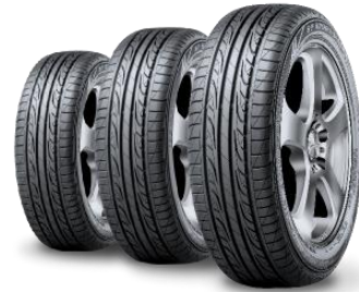
ผลิตภัณฑ์จากยางธรรมชาติ

ที่มา: https://cc.lnwfile.com/_cc/_raw/nm/1e/15.jpg