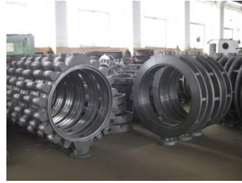
ผลิตภัณฑ์จากเหล็กหล่อ