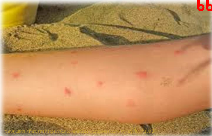
ขอบคนแพ้ลงรูปภาพ https://tonlover.com/2015/04/09/2015/04/09/2015/04/09/2015/04/09/ ของเราคลิกที่นี่ได้เลย