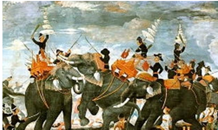
ภาพที่ ๑๐ พระสุริโยทัยขาดคอช้าง

ผู้แต่ง พระบาทสมเด็จพระจุลจอมเกล้าเจ้าอยู่หัว ที่มาของเรื่อง