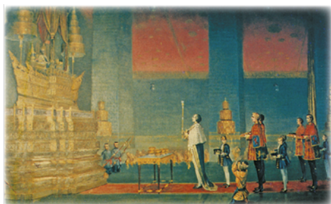
เซอร์จอห์น เบาว์ริงเข้าเฝ้าถวายพระราชสาส์นของสมเด็จพระนางเจ้าวิกตอเรีย แต่พระบาทสมเด็จพระจอมเกล้าเจ้าอยู่หัว