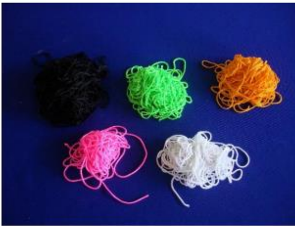
๙. ไหมญี่ปุ่น