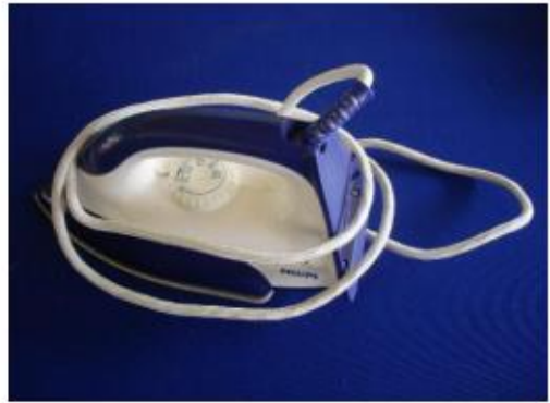
๘. เตารีดไฟฟ้า