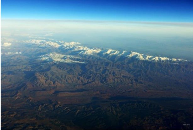
ภาพ : เทือกเขาแอตลาส ในประเทศโมร็อกโก

เป็นภูเขาสูงใหญ่หลายลูกวางตัวเป็นแนวต่อเนื่องกันเทือกเขาแอตลาส เทือกเขาดราเคนส์เบิร์ก เป็นต้น