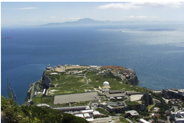
ภาพ ทะเลเมดิเตอร์เรเนียน ถ่ายจากแหลมฮอว์น

เป็นแหล่งน้ำเค็มตามธรรมชาติ มีขนาดเล็กกว่ามหาสมุทร ในแอฟริกา มีทะเลสำคัญได้แก่ ทะเลเมดิเตอร์เรเนียน ทะเลแดง เป็นต้น