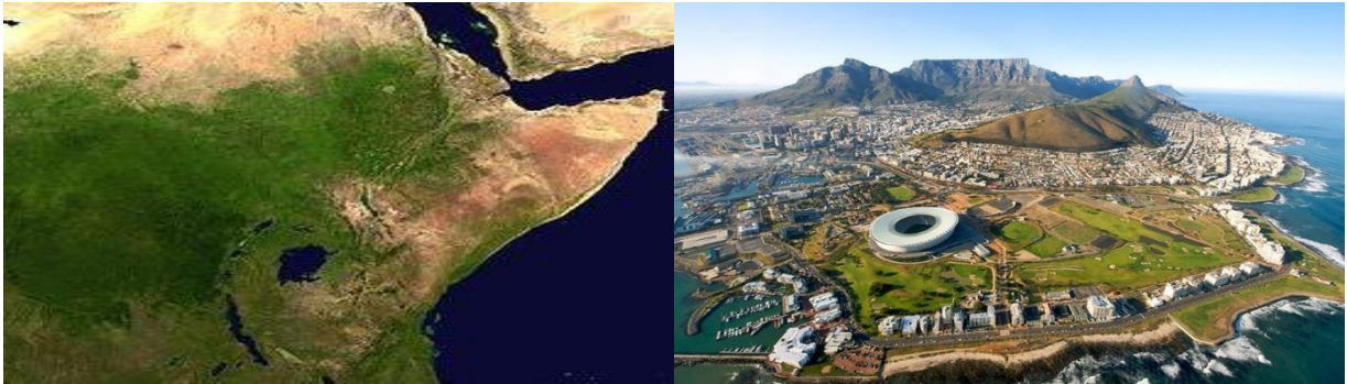
ภาพ คาบสมุทรโซมาเลีย ในประเทศโซมาเลีย

เป็นส่วนหนึ่งของแผ่นดินใหญ่ที่ยื่นล้าออกไปในทะเลหรือมหาสมุทร ในทวีปแอฟริกา มีคาบสมุทรสำคัญได้แก่ คาบสมุทรโซมาเลีย คาบสมุทรแอฟริกา