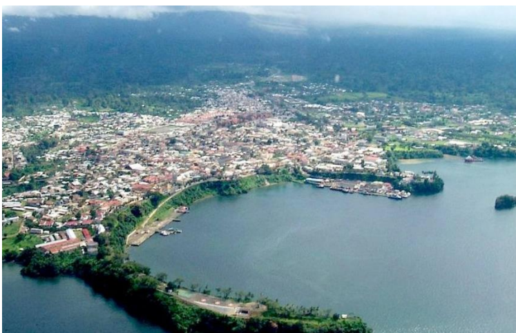
ภาพ : อ่าวกินี

คือส่วนของมหาสมุทร ทะเล หรือทะเลสาบที่ล้ำเข้าไป หรือในแผ่นดิน มีลักษณะเว้า และเปิดกว้าง