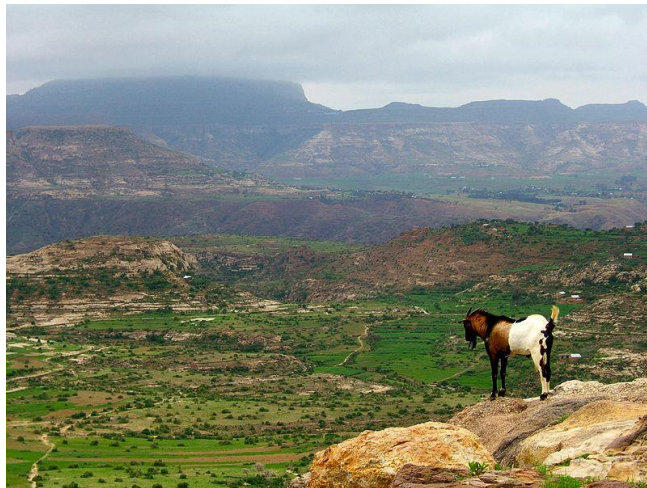
ภาพ : ที่ราบสูง

เป็นพื้นที่ค่อนข้างราบ โดยมีความสูงกว่าพื้นที่บริเวณใกล้เคียงตั้งแต่ 300 เมตรขึ้นไป ที่ราบสูงได้แก่ ที่ราบสูงเอธิโอเปีย ที่ราบสูงดาร์ฟูร์ ที่ราบสูงอาตามาวา ที่ราบสูงบีเอ ที่ราบสูงจอส