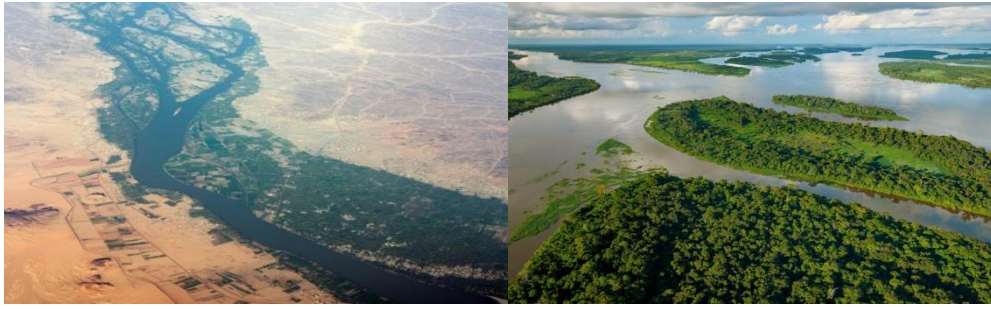
ภาพ: แม่น้ำไนล์