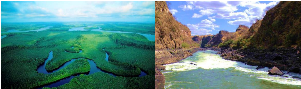
ภาพ: แม่น้ำคองโก

มีบริเวณรอบข้างที่เหมาะสมกับการทำเกษตรกรรมที่สำคัญของทวีปเนื่องจากมีดินที่อุดมสมบูรณ์เป็นเขตที่ประชากรอาศัยอยู่อย่างหนาแน่นและเป็นเส้นทางคมนาคม ในแอฟริใต้แก่ แม่น้ำไนล์ แม่น้ำไนเจอร์ แม่น้ำคองโก แม่น้ำแซมเบซี เป็นต้น