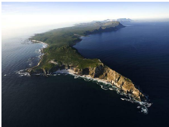
ภาพ แหลมกู๊ดโฮป ในประเทศโซมาเลีย

เป็นส่วนหนึ่งของคาบสมุทร มีลักษณะเป็นส่วนหนึ่งของแผ่นดินเล็กๆ ยาวเรียวยื่นออกไปในทะเล ซึ่งในทวีปแอฟริกา มีแหลมสำคัญได้แก่ แหลมกู๊ดโฮป แหลมอะกะกัส แหลมเวิร์ต