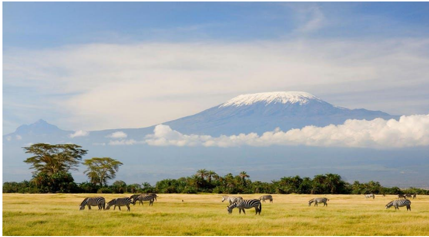
ภาพ : ภูเขาคีรีมันจาโร