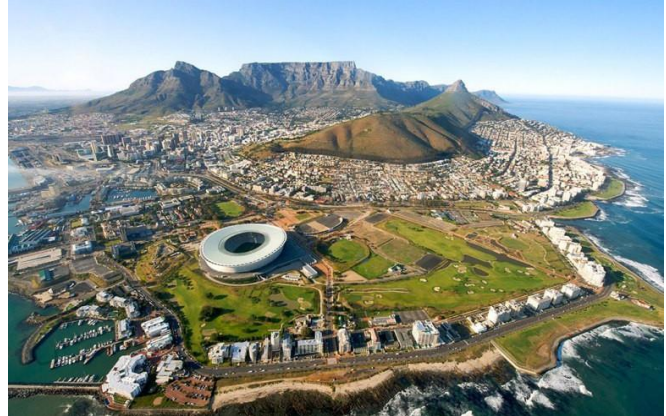
ภาพ : เทือกเขาดราเคนส์เบิร์ก ในแอฟริกาใต้