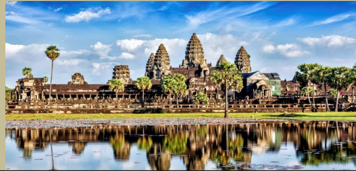
อาณาจักร กัมพูชา