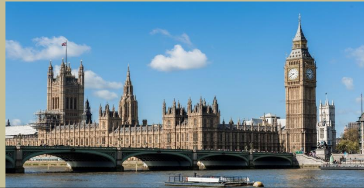
อังกฤษ (ดินแดนตะวันตก)