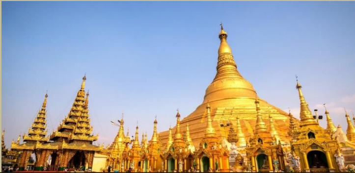
อาณาจักร พม่า